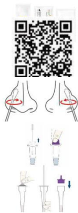
Пробирка «Б»: пробирка с выдвижной крышкой, похожей на серебряный язычок

5. Держите тампон после взятия пробы с одной стороны, а пробирку с образцом - с другой. Если крышка пробирки для образцов фиолетовая, это Пробирка «А». Если колпачок пробирки для отбора проб представляет собой колпачок из серебристого металла, похожий на язычок, это Пробирка «Б».